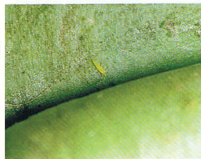
61. "תריסס" חודר בין שני עלים בבסיס הארטישוק.