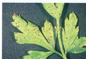
145. כתמים קטנים רבים בצבע חום כהה על העלים אינם סימן לנגיעות.