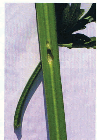
143. כרסום חיצוני של זחלים וחלזונות בקלח כרפס.