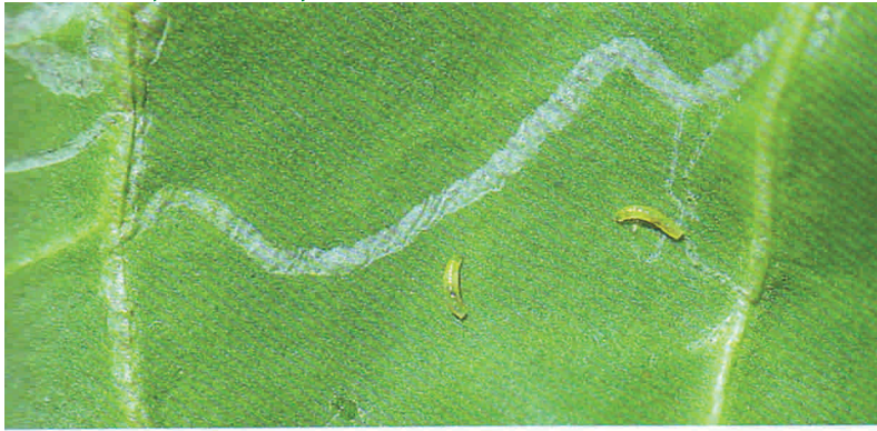
רימות "זבוב המנהרות" שהוצאו מתוך המנהרות. גודלן 3-1 מילימטר (תמונה מוגדלת).