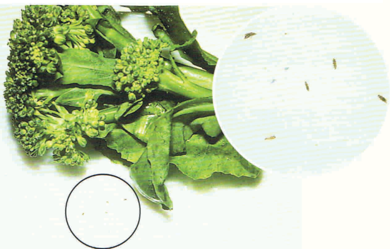
82. תריססים שהוצאו מענף ברוקולי זה.