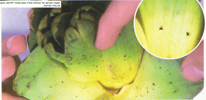
59. הארטישוק עלול להיות נגוע על ידי חרקים רבים. לעתים על ידי מאות חרקים בראש אחד.