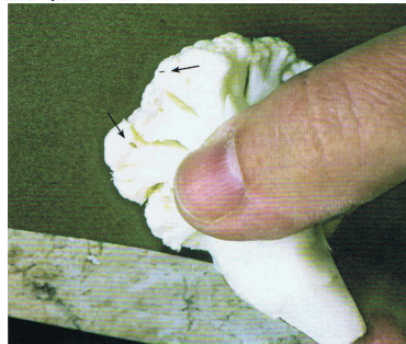
המכה המורכב על הזרובית מהווה מקום מסוור לחיפים. בתמונה: "מגפות עלה" ו"תריסס" בין מריח התבנית.