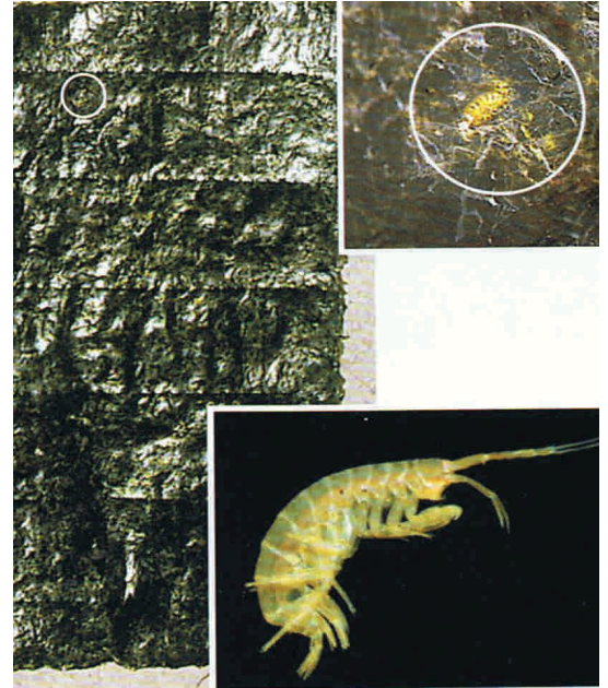
דף אצות נורי עם סרטן זעיר בתוכו (Amphipoda). בעיגול ב