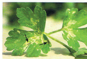
144. רימת "זבוב המנהרות" בתוך עלו הסלרו.